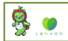
3: 胸・アルクマ刺繍 袖・しあわせ信州プリント