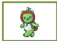
1: 胸・アルクマ刺繍