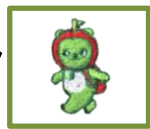
1:胸・アルクマ刺繍