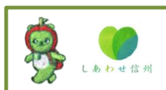
3:胸・アルクマ刺繍 袖・しあわせ信州プリント