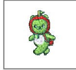
1：胸・アルクマ刺繍