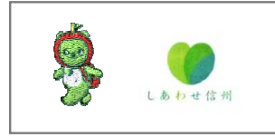
3 胸・アルクマ刺繍 袖・しあわせ信州プリント